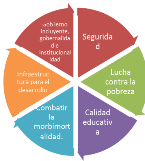
Gráfica 7. Principales retos a afrontar con la gestión de gobierno.

Los componentes que se tienen como reto son: 1). Seguridad, en lo que concierne a ciudadana, hídrica, alimentaria y agraria; 2). Lucha contra la pobreza; 3). Calidad educativa; 4). Combatir la morbilidad; 5). Infraestructura para el desarrollo y 6). Gobierno incluyente, gobernalibidad e institucionalidad. Ve la figura No. x