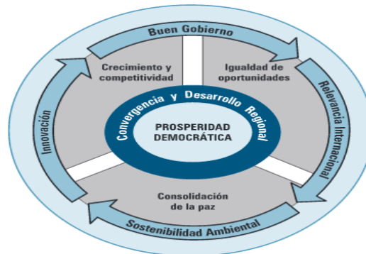
Gráfica 2. Ejes del Plan Nacional de Desarrollo, 2010-2014

El objetivo del Plan Nacional de Desarrollo 2010-2014, es de ser el mapa y la brújula para abordar y resolver las necesidades apremiantes de la nación y aprovechar sus potencialidades, pero sobre todo para sentar las bases que nos permitan alcanzar las metas y garantizar el cumplimiento de la visión de país y los compromisos del programa de gobierno con el cual el pueblo colombiano eligió al presidente Juan Manuel Santos.