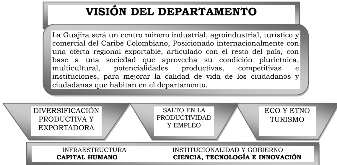
Gráfica 3. Visión del Departamento.

Además, el Plan para la consecución de la visión 2032 plantea el desarrollo y ejecución de tres ejes estratégicos verticales: la diversificación productiva y exportadora, salto a la productividad y empleo y el eco y etno turismo; soportados en cuatro ejes transversales: infraestructura, institucionalidad y gobierno, capital humano y ciencia y tecnología e innovación.