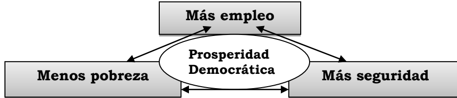
Gráfica 1. El Plan Nacional de Desarrollo 2010-2014: “Prosperidad Para Todos”.

El Plan Nacional de Desarrollo 2010-2014, “Prosperidad para todos”: más empleo, menos pobreza y más seguridad. Con un costo de 485 billones de pesos, inversión sin precedentes en el territorio nacional, ha sido uno de los planes más ambiciosos que se haya formulado en Colombia; siendo su principal meta: reducir la pobreza en cinco dígitos, es decir, pasar de 45.5 a 39.5% en los cuatro años de gobierno.