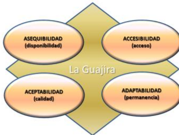
Gráfico 4. Atributos de derechos

En este entorno, el enfoque diferencial busca evaluar el estado o situación de un grupos social para determinar su situación de vulnerabilidad, la asequibilidad a bienes y servicios que ofrece la sociedad y el Estado, la accesibilidad a los mismos, la aceptabilidad y la adaptabilidad, en aras de promover su desarrollo social con oportunidades de crecimiento.