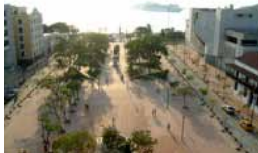
Plaza de Bolívar, Santa Marta, Magdalena