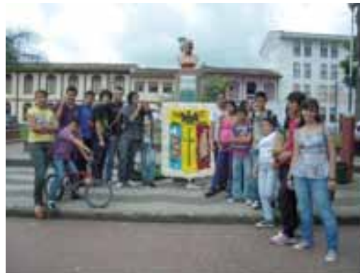
CMM Sevilla (Valle del Cauca)