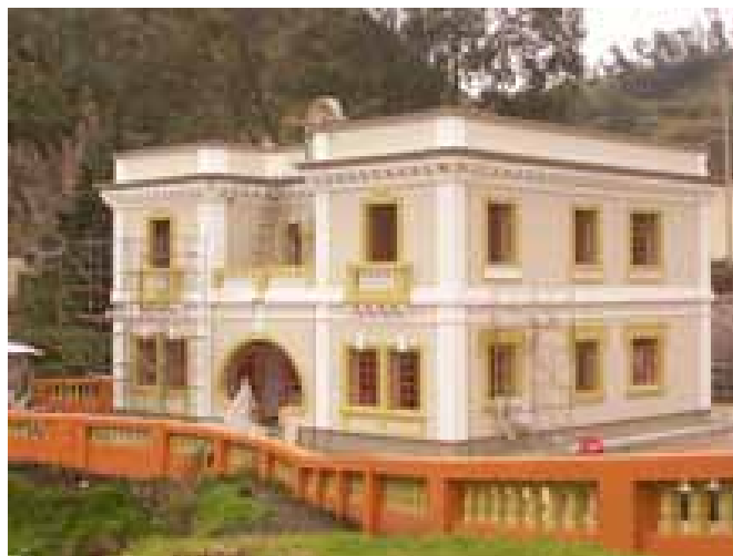
Edificio del Mercado público de Lorica, Córdoba . Casa de Aduanas Rumichaca – Ipiiales, Nariño