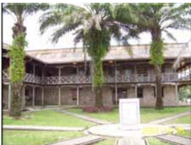
Casa Arana – La Chorrera, Amazonas

Un bien o una manifestación pueden cumplir todos o algunos de los criterios establecidos, pero el ámbito de la declaratoria o de la inclusión en la LRPCI, es decir, si es nacional o territorial (departamental, distrital, municipal o de territorios indígenas y comunidades negras, según lo especifica la Ley 70 de 1993), depende de su representatividad e importancia dentro del ámbito al que pertenece.