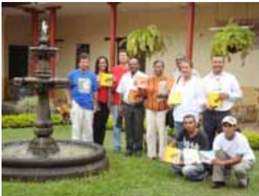
CMM de Santander de Quilichao (Cauca).