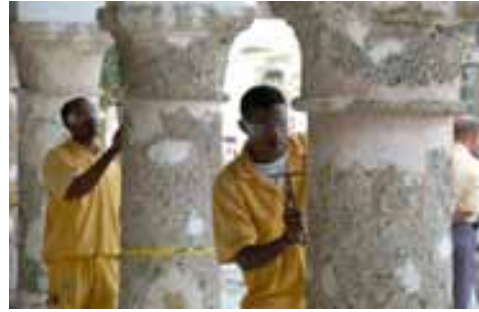
Taller de Forja y Fundición. Escuela Taller Santa Cruz de Mompox Taller de Cantería. Escuela Taller Cartagena de Indias